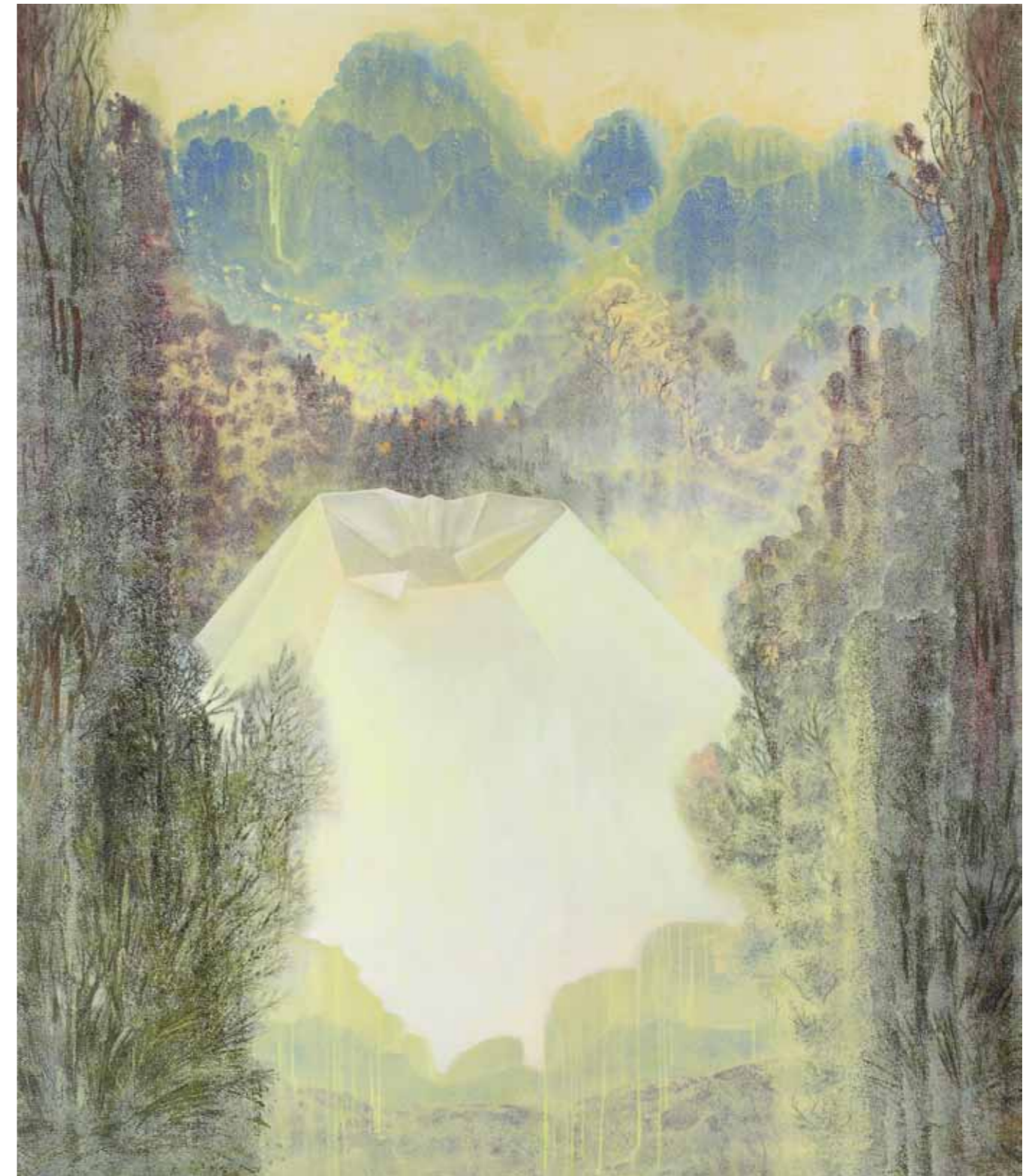
Nevinnost / Innocence

2010 akryl a olej na plátně / acrylic and oil on canvas 185 x 160 cm