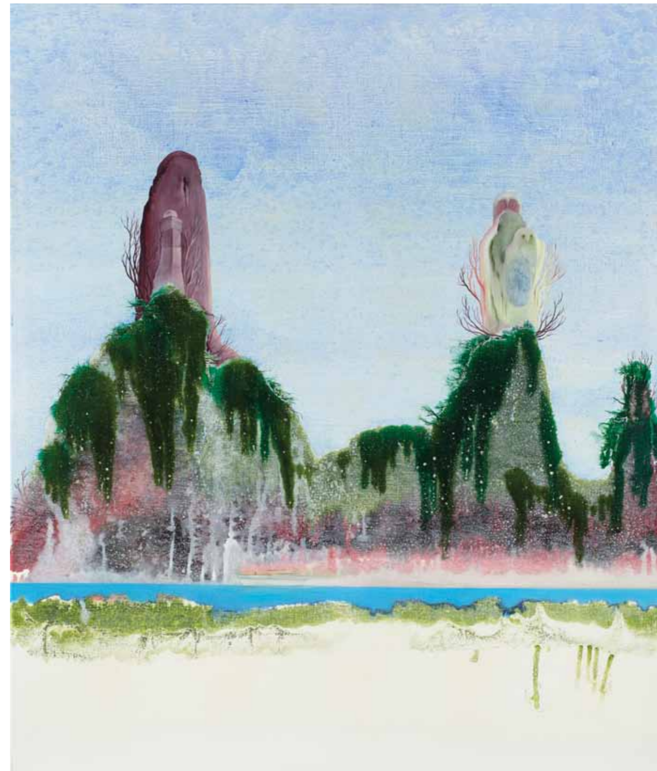
Sen o Asii Dream of Asia 2011 akryl a olej na plátně / acrylic and oil on canvas 135 x 115 cm