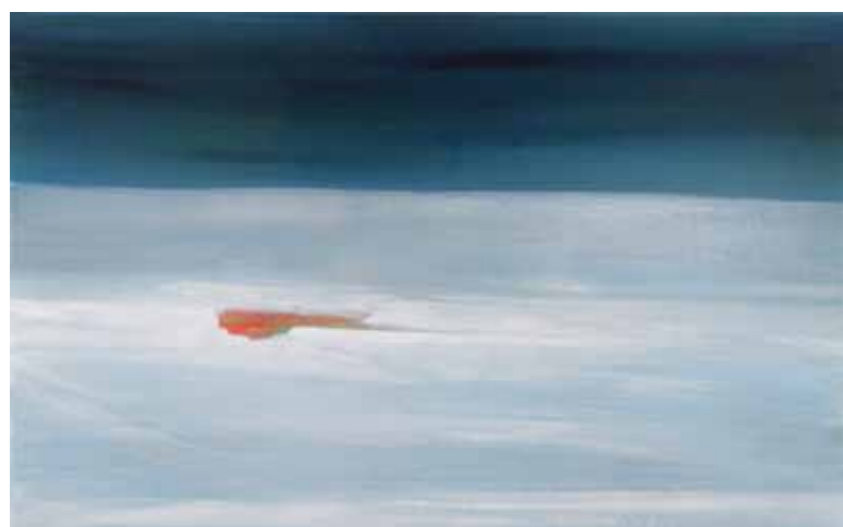
Inside out I 2009 akryl a olej na plátně / acrylic and oil on canvas 50 x 80 cm