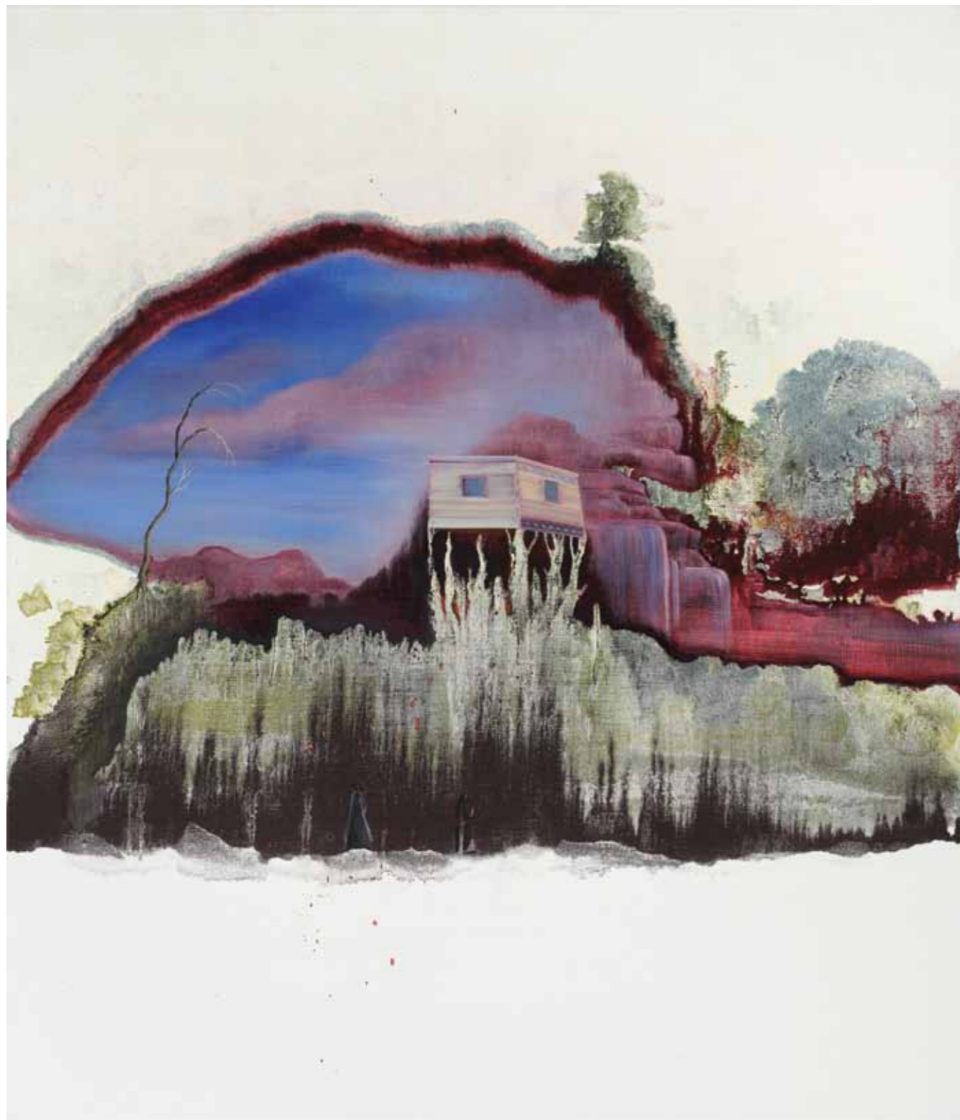
Sen o dvou jeptiškách Dream of two Nuns 2011 akryl a olej na plátně / acrylic and oil on canvas 135 x 115 cm