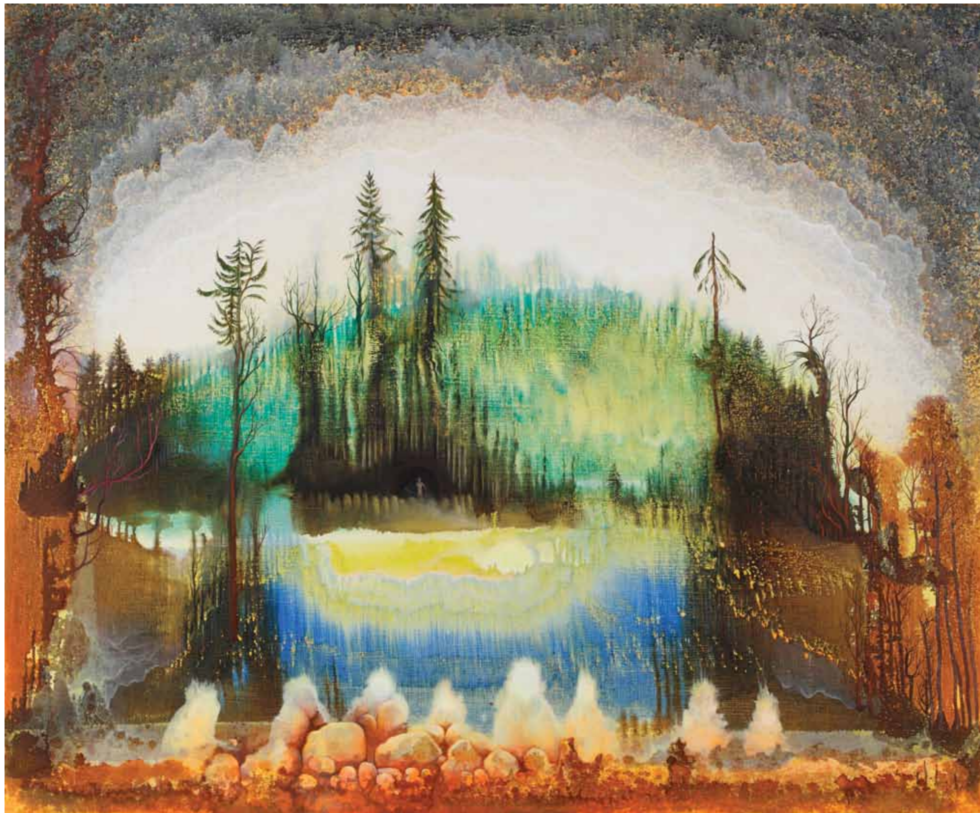
Odras slunce Echo of Sun 2010 akryl a olej na plátně / acrylic and oil on canvas 185 x 225 cm