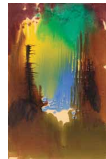
Láska Love 2009 akryl a olej na plátně / acrylic and oil on canvas 60 x 40 cm