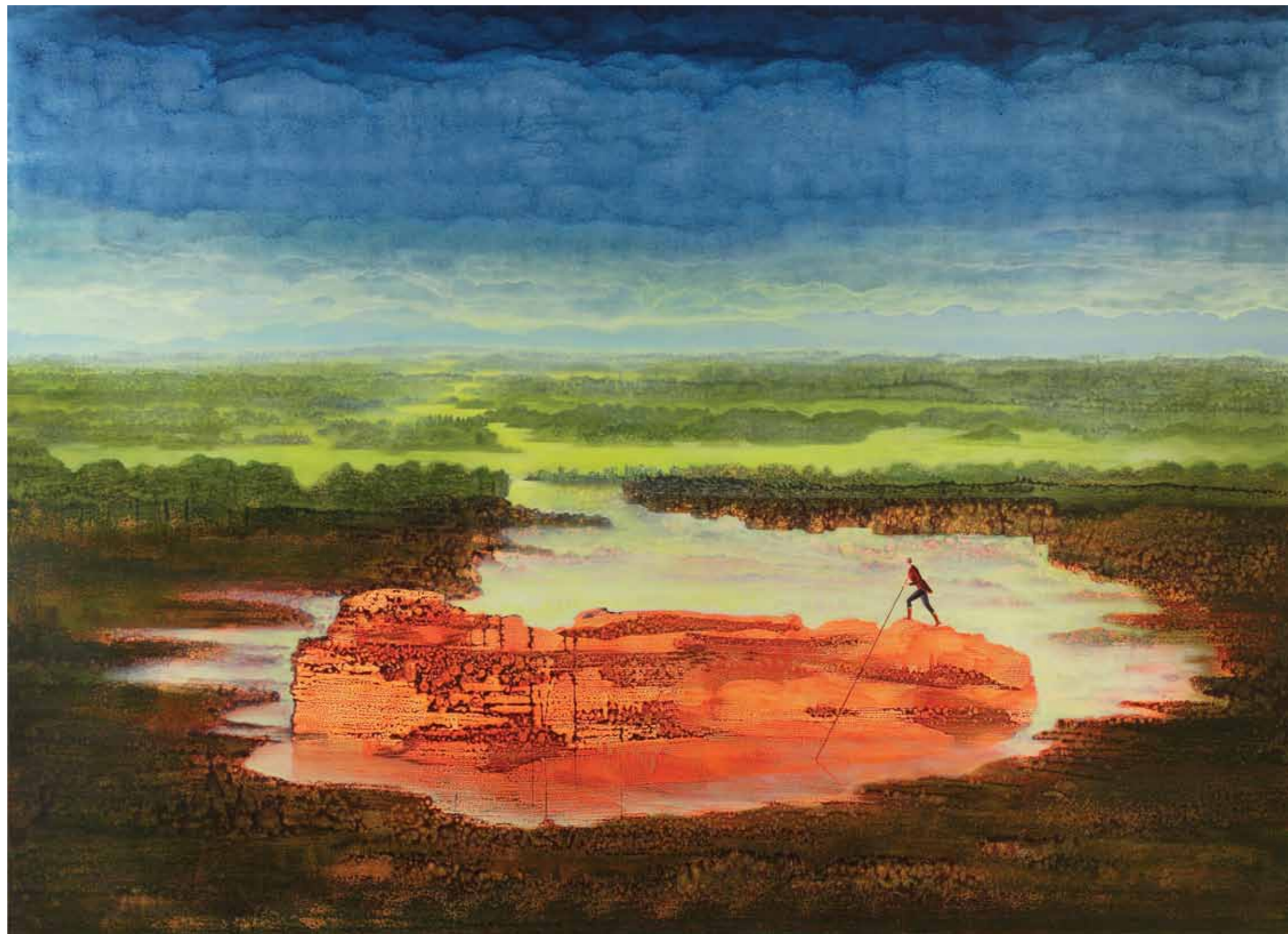
Hledající Seeker 2010 akryl a olej na plátně / acrylic and oil on canvas 180 x 250 cm